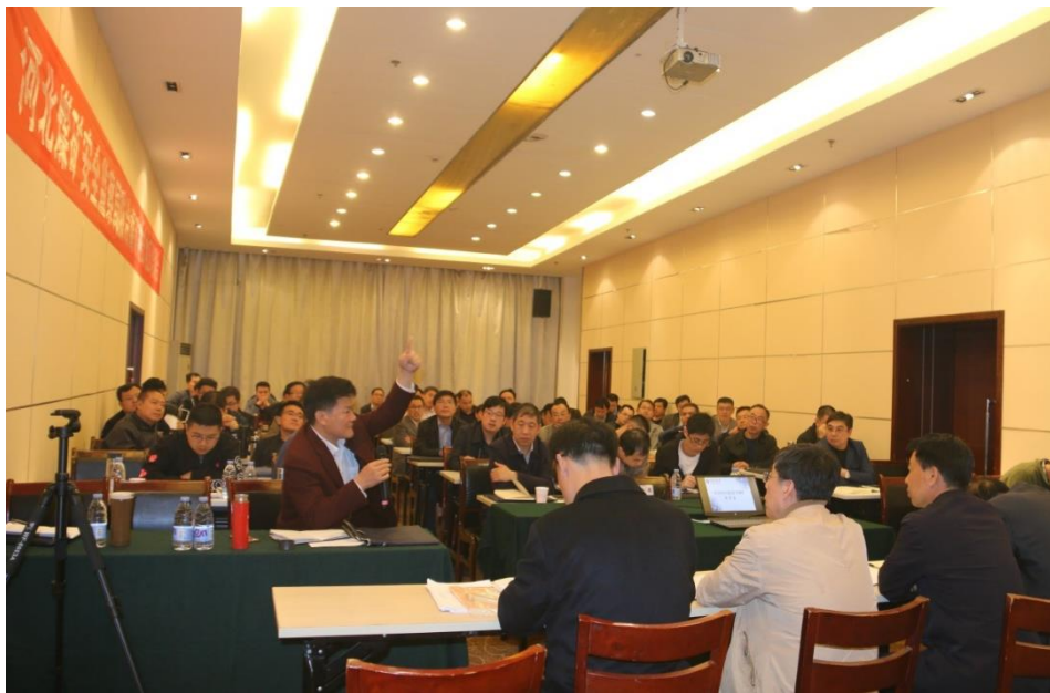
河北省调研座谈会现场

编制工作组经过集中编写、多次专题研讨等方式，顺利完成了《手册》试行稿编制工作，《手册》于 2020 年 3 月 13 日开始试行。