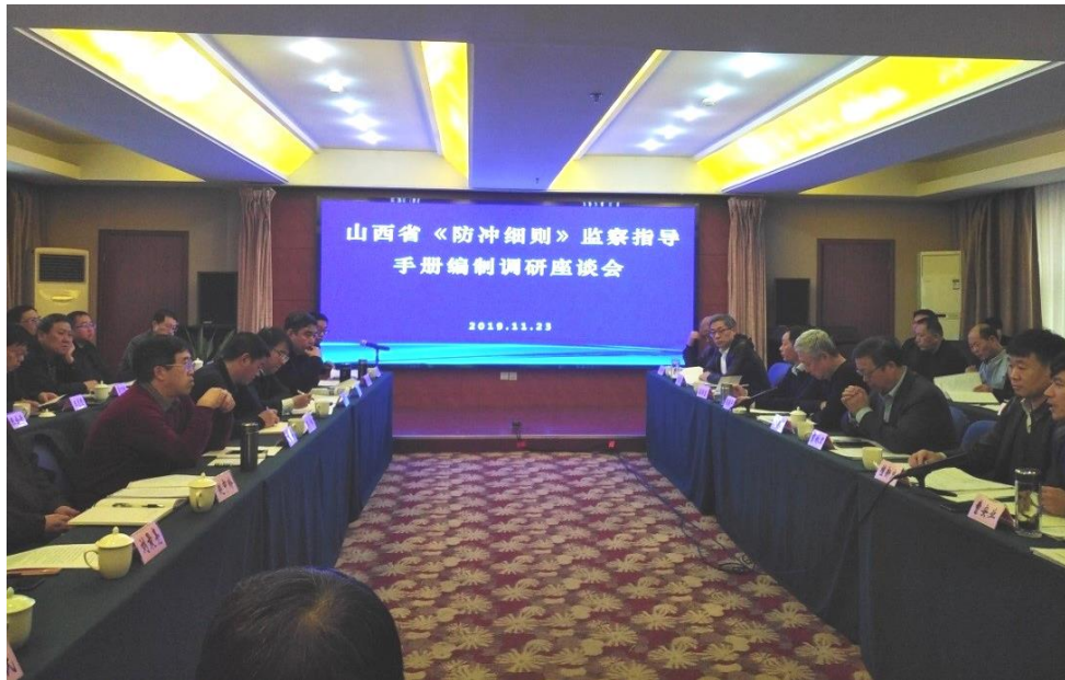
山西省调研座谈会现场